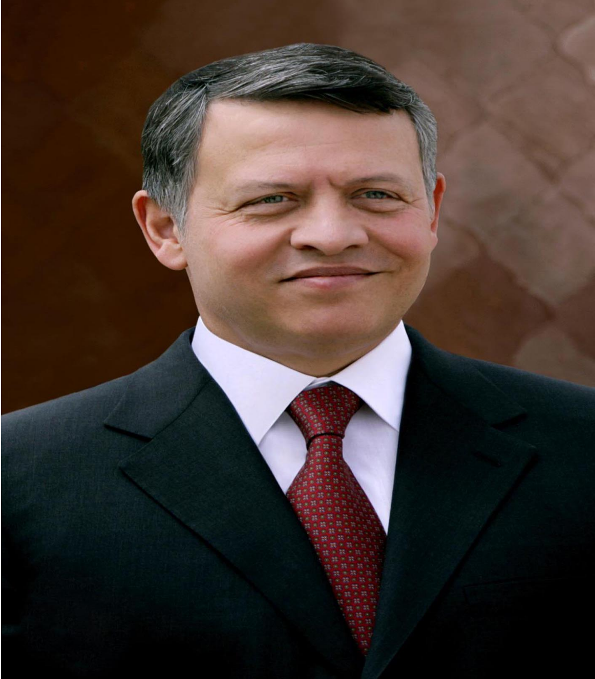
حضرة صاحب الجلالة الملك عبدالله الثاني بن الحسين المعظم