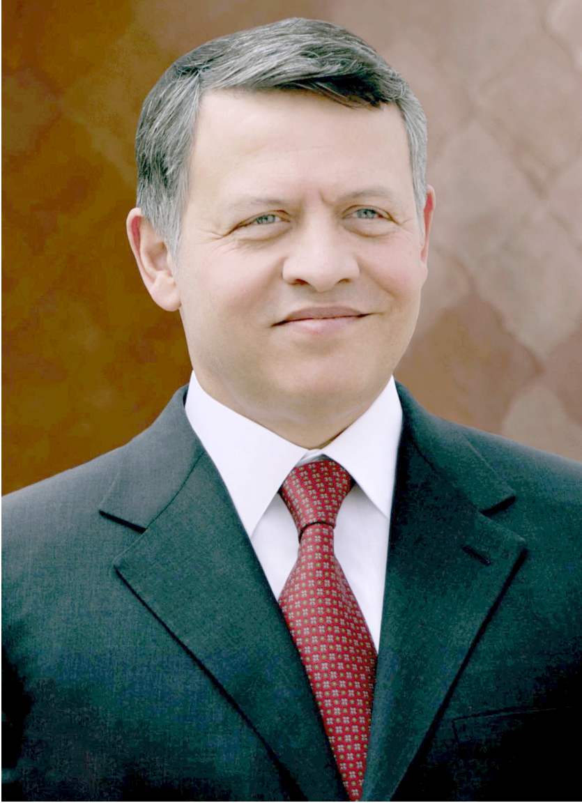
حضرة صاحب الجلالة الملك عبد الله الثاني بن الحسين حفظه الله ورعاه